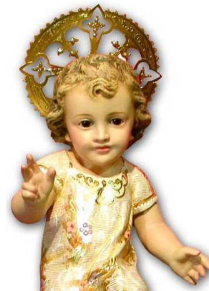
Niño Jesús de Praga